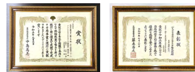
東京都建設局優良工事等表彰

創業から培った信頼の技術は 東京都建設局優良工事等表彰の 10年連続受賞という功績として認められ 官公庁から多くの信頼を得ています。