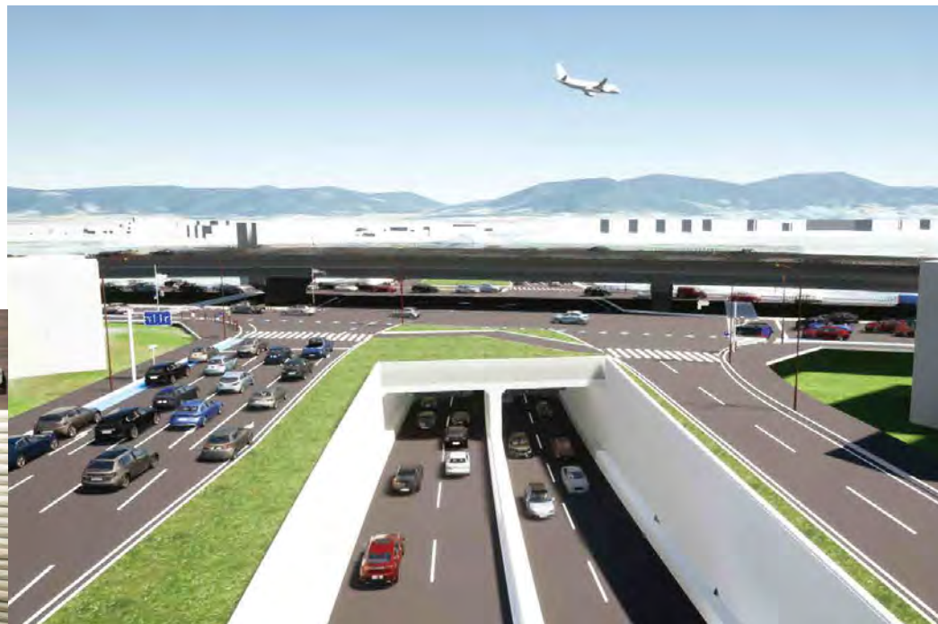
博多バイパス(空港口工区)の立体交差バース